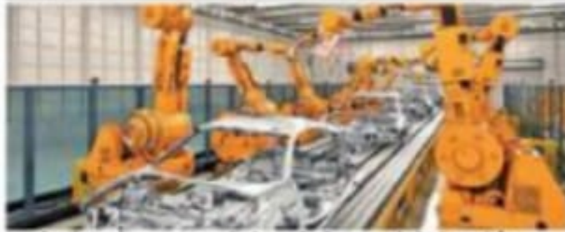
पहलाने की बिजली लगाकर बढ़ने से आई प्रोडक्शन में तेजी आई है।